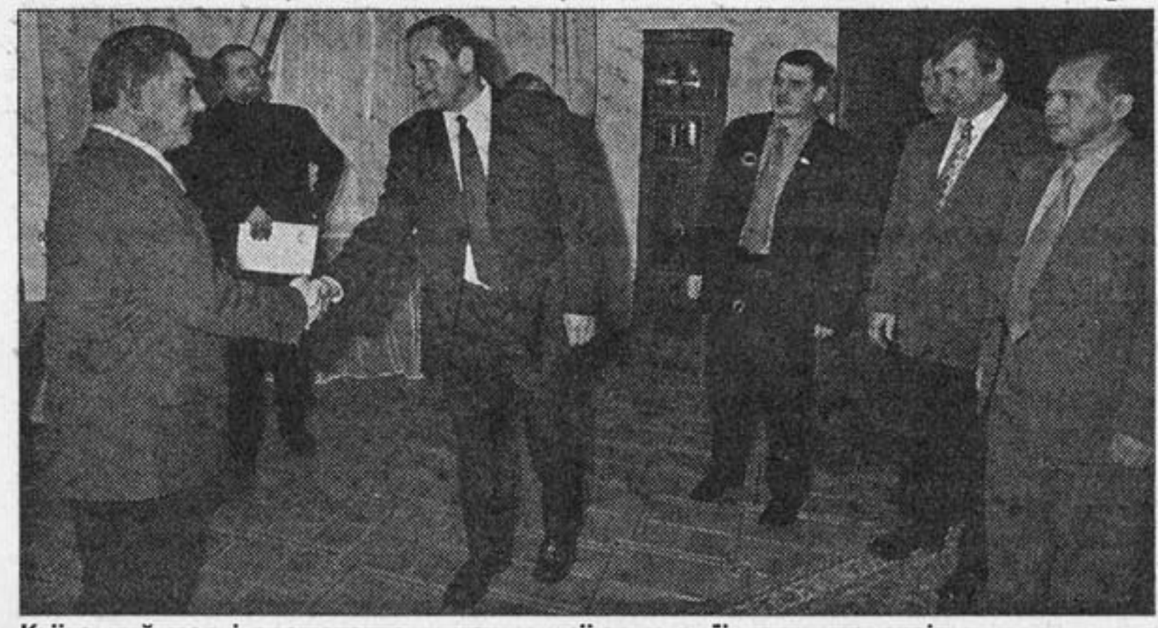
Київський мер і представники кримської делегації: крок назустріч

Оскільки зустріч відбулася напередодні виборів, не могли не торкнутися й деяких аспектів політичного життя. Точніше, сфери місцевого самоврядування. Член Президії Верховної Ради Криму Олександр Шацьких та Київський міський голова одностайні у тому, що самоврядні органи мають бути самостійними, як це і передбачено Європейською Хартією, що державний бюджет повинен формуватися знизу вгору, а не навпаки. Представник кримського парламенту зробив акцент: їхньому півострову значну увагу приділяє Росія. Особливо Москва, мер якої — Юрій Лужков — частенько сам приїжджає до них у гості. І Олександр Омельченко, вважає пан Шацьких, теж треба виходити на політичний ринг автономії. Тим самим зміцнюючи позиції України і сприяючи поглибленню стосунків з Росією.