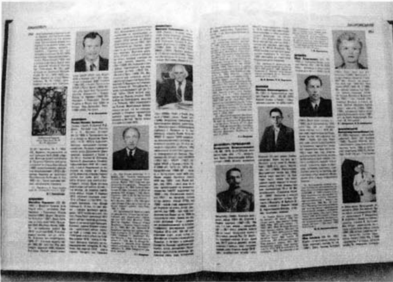
Прекрасний сучасний дизайн – одна з головних рис ЕСУ.