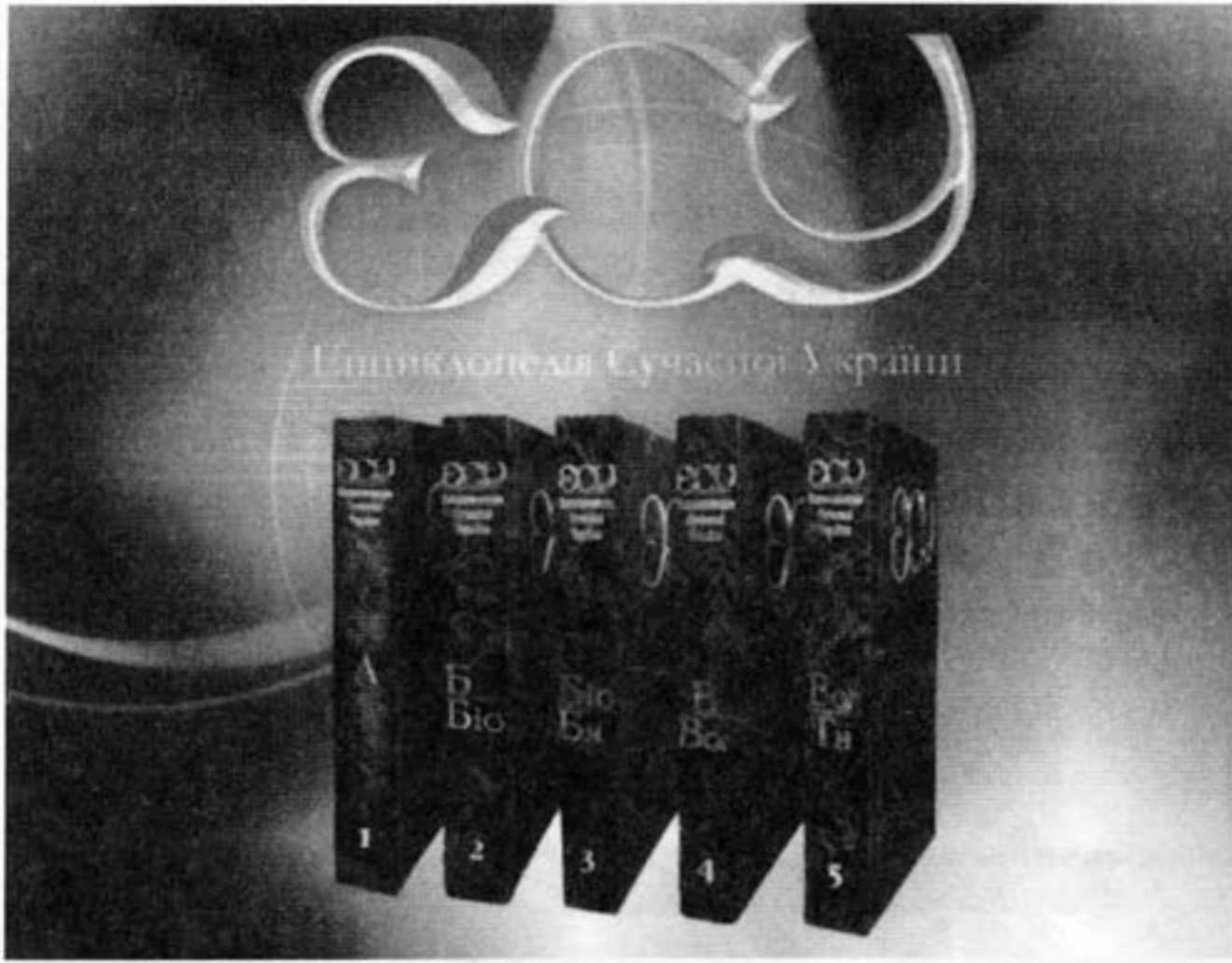
Перші п'ять томів Енциклопедії Сучасної України.